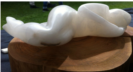
"Dormi bene", "Slaap Zacht" transparant voor licht

Persoonlijk ervaar ik Albast als een steen die door bewerking - zoals raspen en schuren - haar binnenste laat zien. Het " binnenste-buiten " doordat de huid transparant wordt en als het ware gaat leven in je handen en laat zien wat er binnen in de steen speelt.