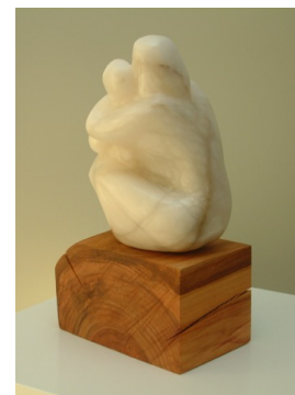
"Amore materno", "Moederliefde"

Witte Albast met aders die naar voren komen bij het polijsten. Champagne Albast met haar subtiele bloemige kleurnuances. Tijgeroog Albast die het licht lijkt op te nemen. Allen geven zij deze steen in haar verscheidenheid een pakkende uitstraling, waarbij dynamiek ontstaat door de speling van het licht. De " Steen van het Licht " verandert: " binnenste-buiten ".